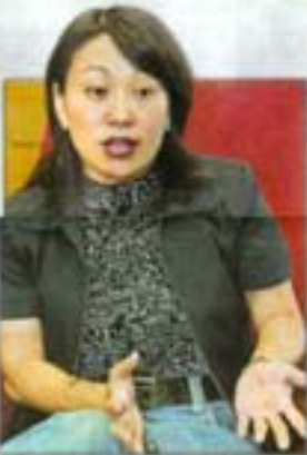
針家玉：要管理好你的錢財，避免陷入重債債務，重要的是先了解自己，然後，找出花錢以外的，解決情緒問題的方法。

然而，這樣的觀念其實並不正確。理財師眼中，除了負債率、保障、投資、稅收、選擇利率之外，債務轉移與償還可以算是一個最基本的